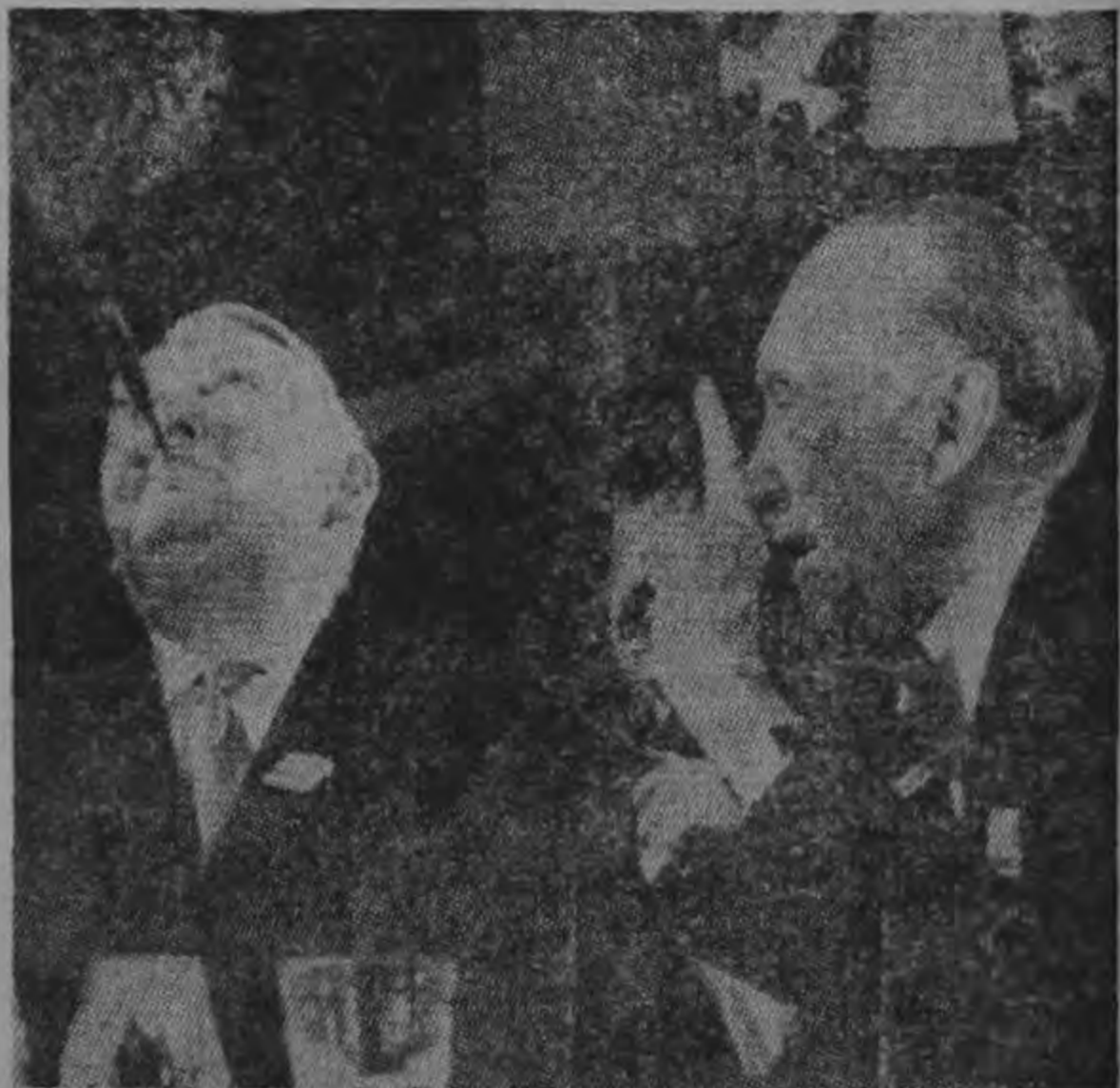
"¡Escucha Ludwig!", parece decir Adenauer al Canciller L. Erhard, mientras éste hace que su cigarrillo forme volutas de humo. La foto fue hecha en una reunión del Partido Demócrata Cristiano de Alemania Occidental en Bonn. Adenauer, de 90 años, sigue siendo figura política del partido.

Horas antes, una manifestación de estudiantes del colegio secundario Mejía fue dispersada por la gendarmería con bombas lacrimógenas.