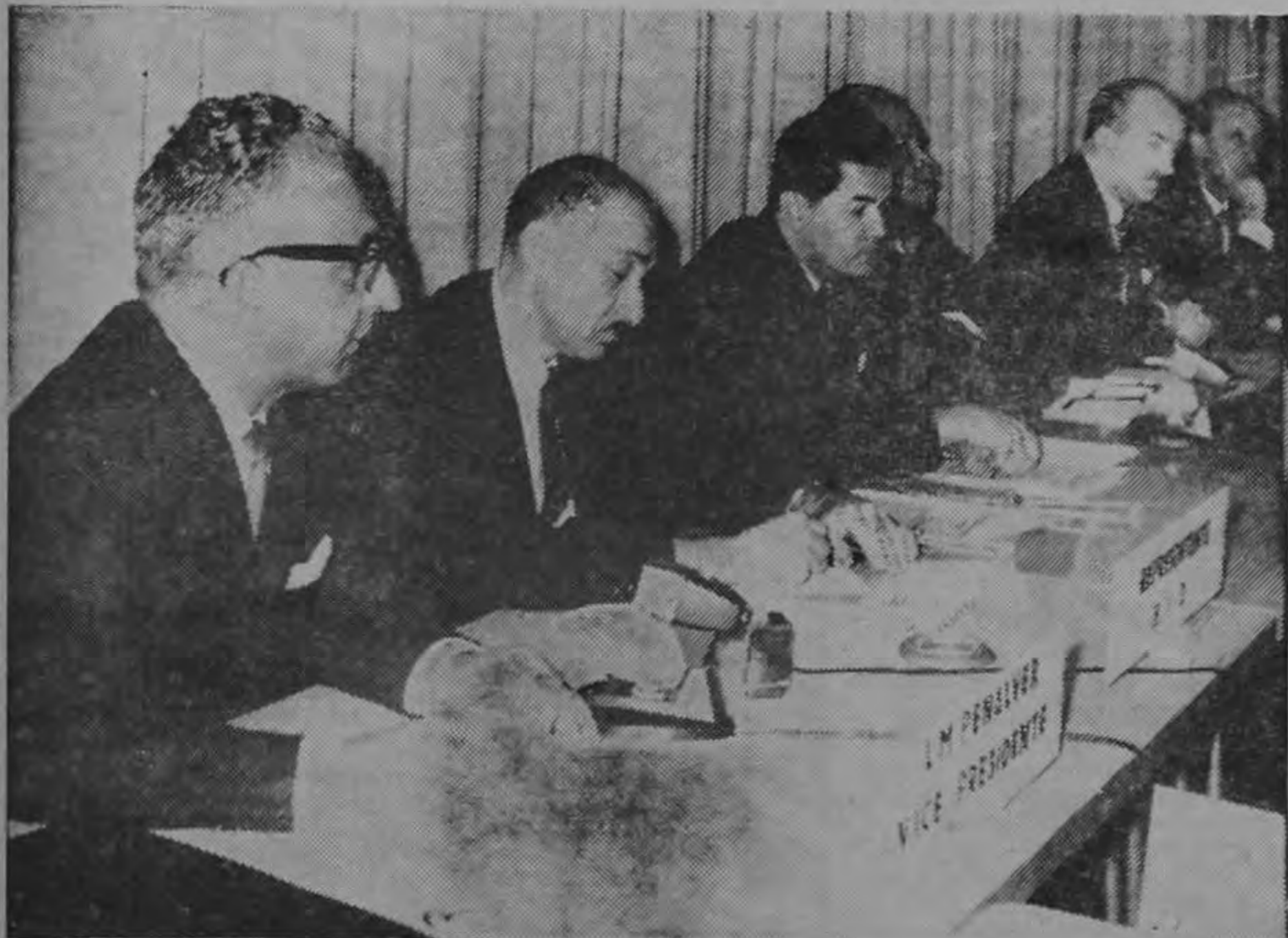
Un momento de la clausura de la "Reunión de Expertos sobre Enseñanza Superior y Desarrollo en América Latina", auspiciada por la UNESCO, ocurrida ayer en la Facultad de Educación de la Universidad a las 11 de la mañana. La reunión se celebró del 15 al 24 de marzo en curso.

Copia de tal comunicación envió la mencionada Cámara a las Juntas Directivas de sus filiales.