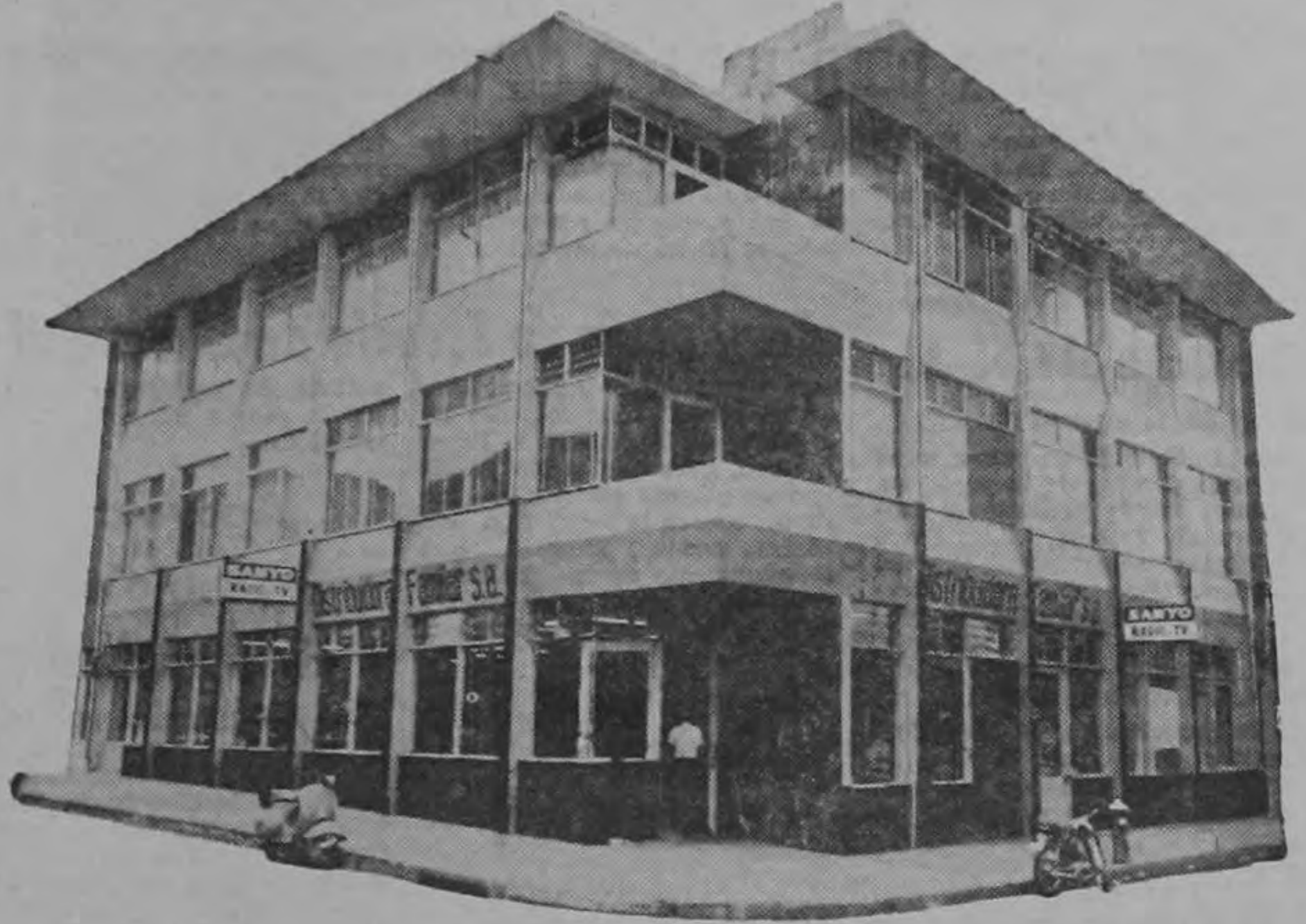
Este es el edificio donde se encuentra DISTRIBUIDORA FAMILIAR, S. A. (DIFAMI) en el EDIFICIO AMARILLO, esquina Sur del Teatro Moderno.

Felicitemos a DISTRIBUIDORA FAMILIAR, S. A. (DIFAMI) en el Edificio Amarillo donde se encuentra "todo para el hogar" por su novedoso sistema de Ventas, el que brinda grandes facilidades a los costarricenses para poder adquirir los artículos necesarios para su hogar.