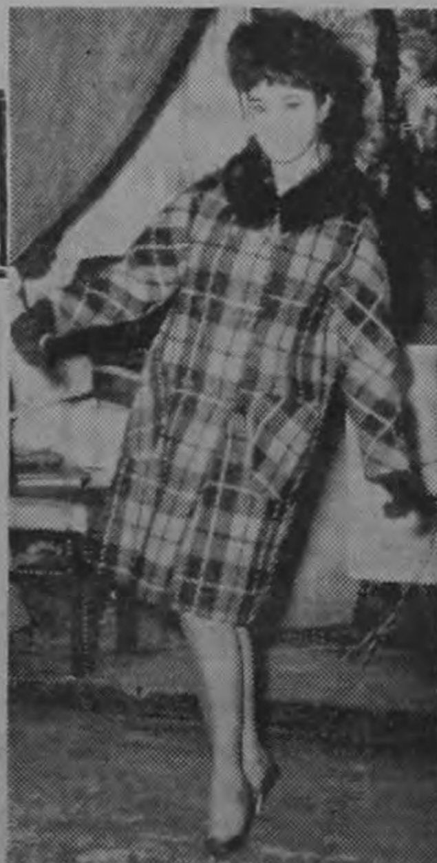
VERNY La Chaparrita de Oro.