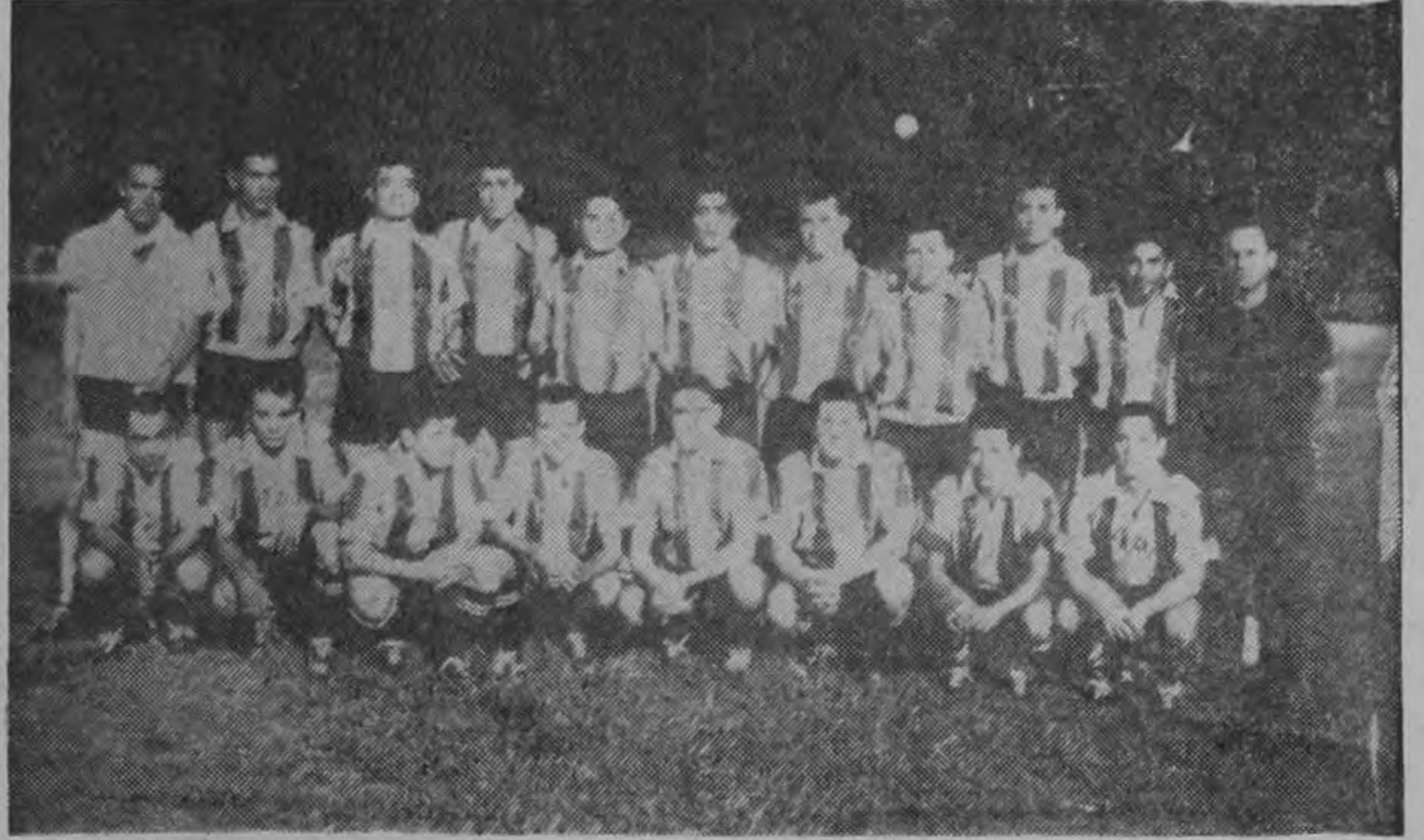
El cuadro nicaraguense se superó enormemente ante los brumosos. Fue un digno rival en todo momento. Su derrota fue tan honrosa que casi podría calificarse de vencedor moral. Hombre por hombre los diriambinos se multiplicaron viéndose obligados los nuestros a jugar con todo empeño.