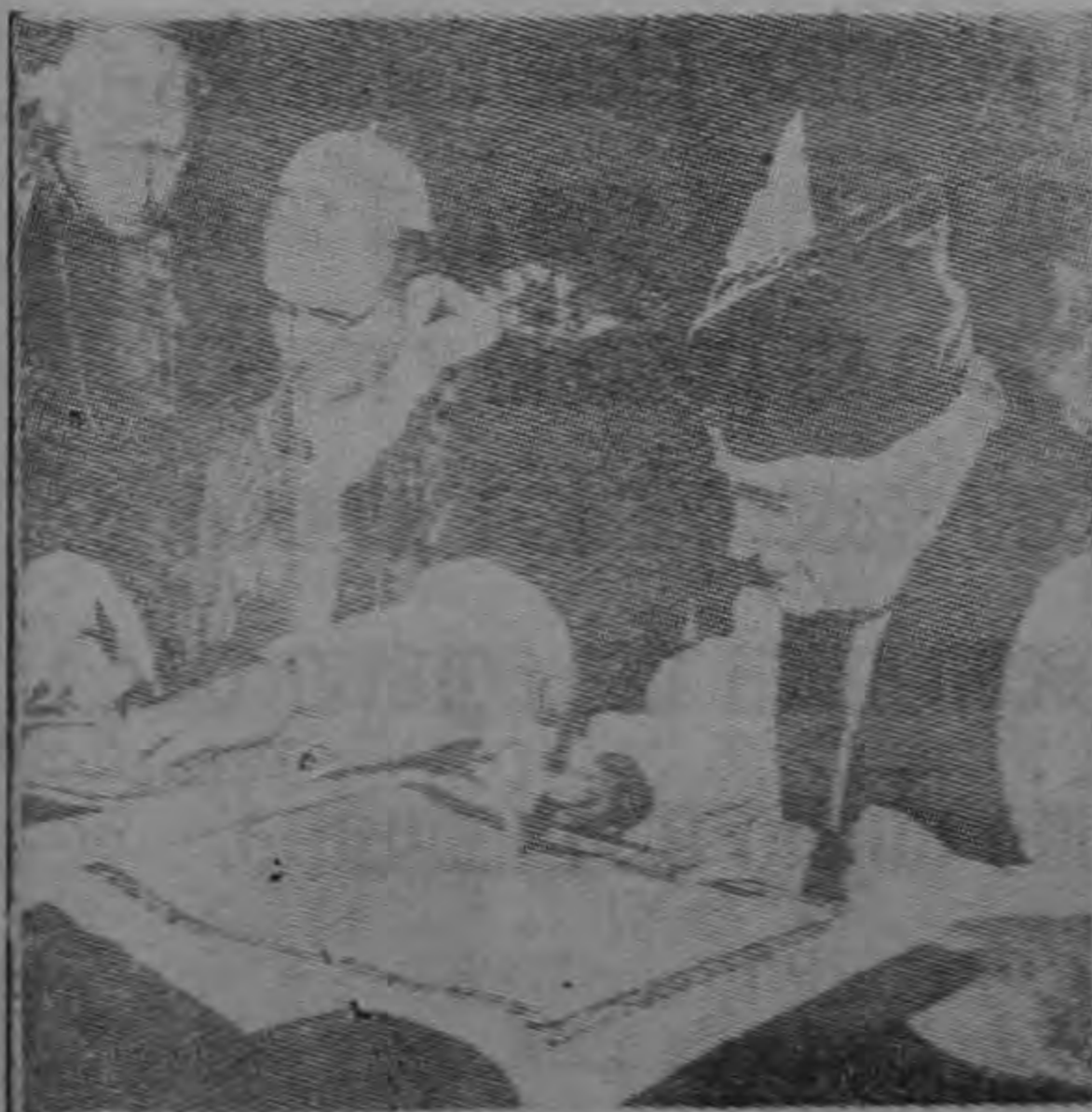
Momentos en que el Papa Paulo VI y el Arzobispo de Canterbury, firmaban el histórico Decreto sobre Unidad, que busca trabajar por la unión de las Iglesias Católica y Anglicana, durante muchos siglos separadas por diferencias que antes parecieron insalvables.

Hynek manifestó que no es probable que los actuales deshielos dejaron escapar vapores atrapados que eran el resultado de materiales orgánicos en descomposición.